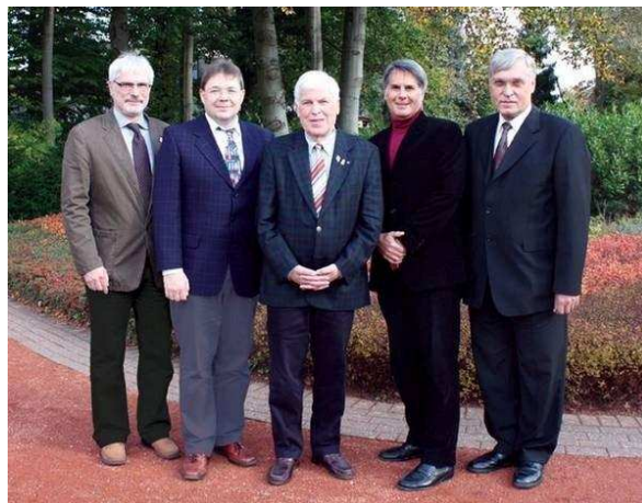
v.l.: DL1DCT, DL7ATE, DL3OAP, DJ0QN, DL8LE

hat nicht mehr zur Wiederwahl kandidiert. Das nachstehende DARC-Photo zeigt den neuen Vorstand.