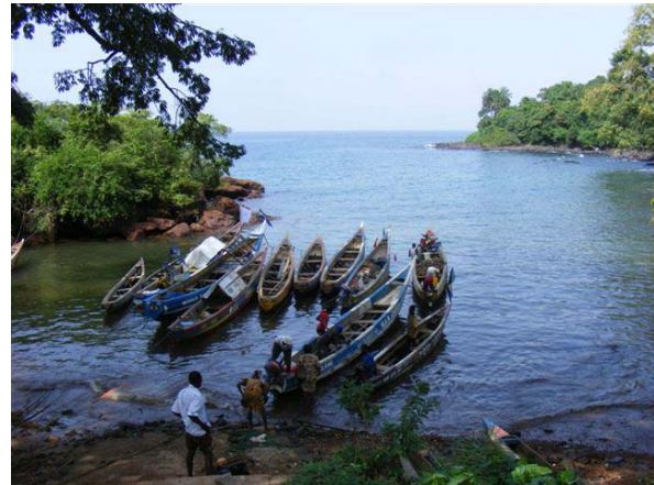
Der Hafen von Rickets

Unterwegs werden noch gegrillte Kassawas, Ananas, Bananen und Mais für das Mittagsmahl gekauft. In Kent angekommen wartete schon das Boot auf uns.