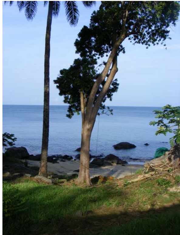
Blick aufs Meer vom Shack aus

Alles hat ein Ende und am 21. November gingen wir an den Abbau der Antennen. Etwa 6000 Verbindungen aus AF-037 waren im Log.