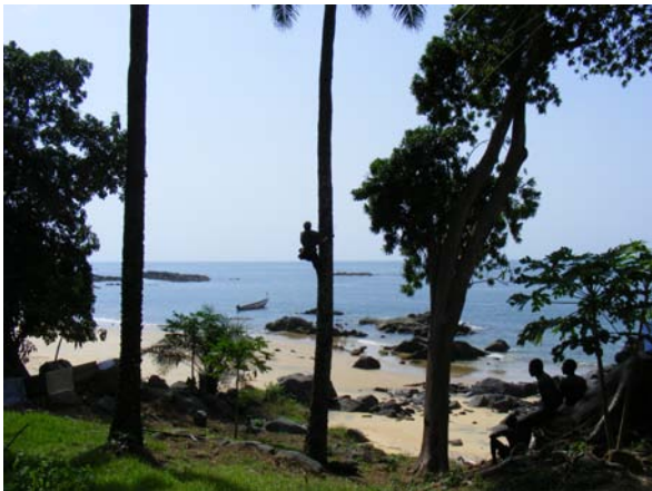
Palmenkletterer befestigt die Antennen

Unsere Hütte steht etwa 15m über dem Meeresspiegel. Vor uns liegt das Meer mit einigen Palmen, welche ca. 20m hoch sind. An diesen werden unsere 160m/80m Vertikal und eine Windomantenne befestigt. Ein Palmkletterer übernahm diese Arbeit. Er war sehr glücklich, als er von uns Kleider und Schuhe für seine Kinder erhielt.