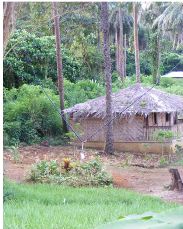
Das QTH mit V-Beam Antenne

Mit einigen Inselbewohnern haben wir das Boot schnell entladen, unsere Kisten, das Benzin und unseren Generator, welchen wir aus Deutschland mitgebracht haben zu unserer Hütte transportiert.