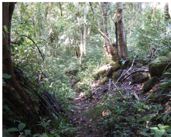
Der Banana-Highway nach Rickets

An einem Tag hatten wir die Möglichkeit, die Inseln mit einem Boot zu umrunden und die kleinere Insel Rickets zu besuchen. Wir wurden vom Dorfältesten herzlich empfangen. Interessant ist auch die üppige Vegetation und die Tierwelt.