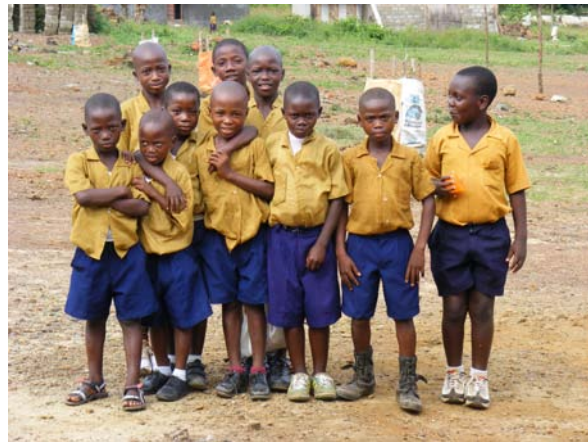
Schulkinder warten auf ihren Transport

Je nachdem, wie viele Gepäckstücke man besitzt, ist es sinnvoll Träger anzuheuern, welche gegen eine „kleine Gebühr“ die Gegenstände zum Taxi transportieren.